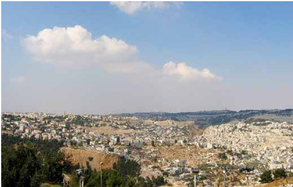
Bethlehem, plaats van Jezus' geboorte (Matth. 2:1) en plek van een gruwelijke kindermoord (Matth. 2:16). Foto: het hedendaagse Bethlehem.